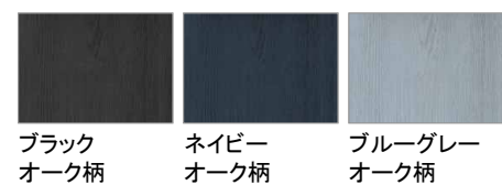
ブラックオーク柄 ネイビーオーク柄 ブルーグレーオーク柄