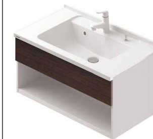
色柄は「ホワイト」になります。