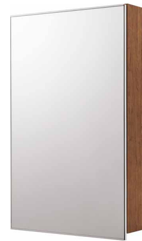
収納付1面鏡(照明なし)