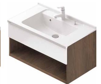
色柄は「カラーミックス」になります。 扉柄:ホワイト(鏡面)・・・ウォールナット柄 扉柄:グレイッシュグリーン・・・メープル柄