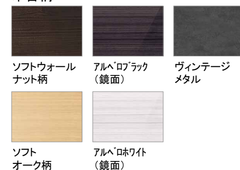
ソフトウォールナット柄 アルペブラック(鏡面) ヴィンテージメタル ソフトオーク柄 アルペホワイト(鏡面)