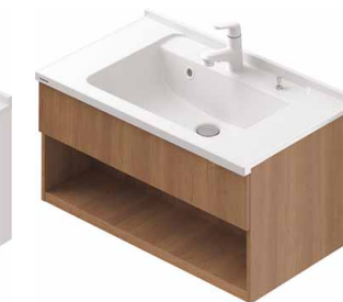
色柄は全て「同じ色柄」になります。