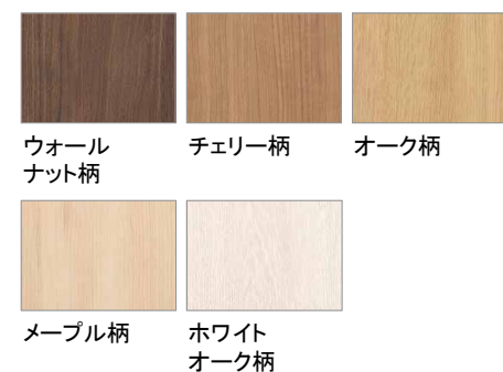
ウォールナット柄 チェリー柄 オーク柄 メープル柄 ホワイトオーク柄