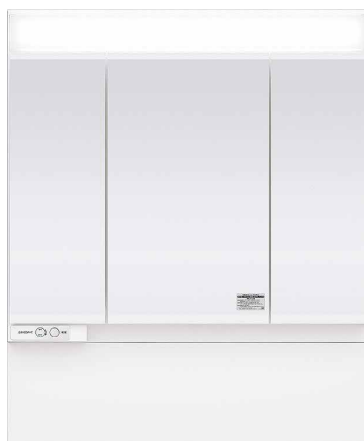
スタンダードLED3面鏡 ミドルパネル