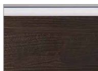
ソフトウォールナット柄