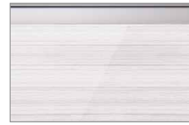
アルペロホワイト(鏡面)