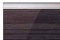
アルペロブラック(鏡面)